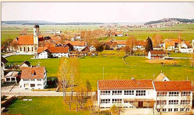
Schule an der Schulstraße mit Erweiterungsbau 1964