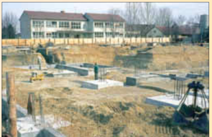
Baubeginn der neuen Verbandsschule 1974